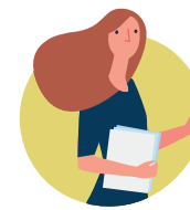
Pèsonèl ki pa ministeryèl.

Kowòdonatè afè entènasyonal ak biwo atache yo.