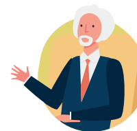
Des agents du ministère public.

Le chef de l'unité d'enquête sur les crimes contre les migrants, qui est responsable du mécanisme.